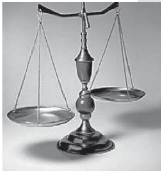
Balanza de la Justicia

Para un mejor análisis y entendimiento de esta ciencia, es necesario resaltar y dedicar un pequeño apartado a la relación de la Criminología con otras disciplinas empíricas como la Psicología, Psiquiatría, Sociología y la Biología y ciencias afines como la Medicina.